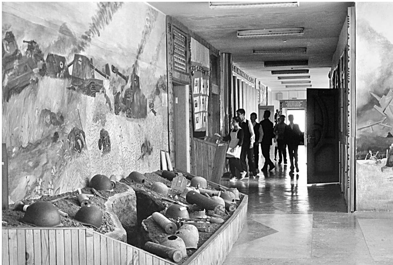
Школьный музей Великой Отечественной войны